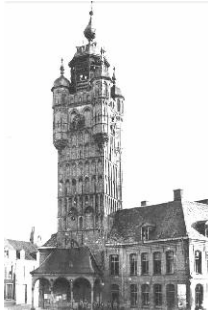
Der Glockenturm vor dem 30. Mai 1940

Der Glockenturm kann mit einem Führer von April bis Oktober am ersten Samstag im Monat oder für Gruppen auf Anfrage besichtigt werden.