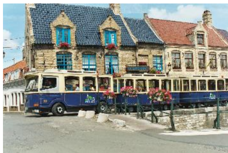
Le Tram 99 au Pont Saint Jean