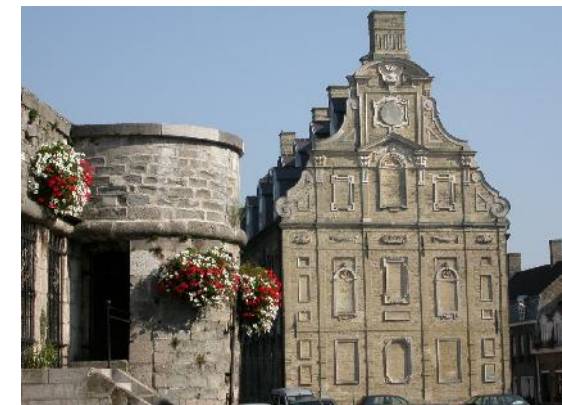
La citerne militaire et le Mont de Piété (Musée)