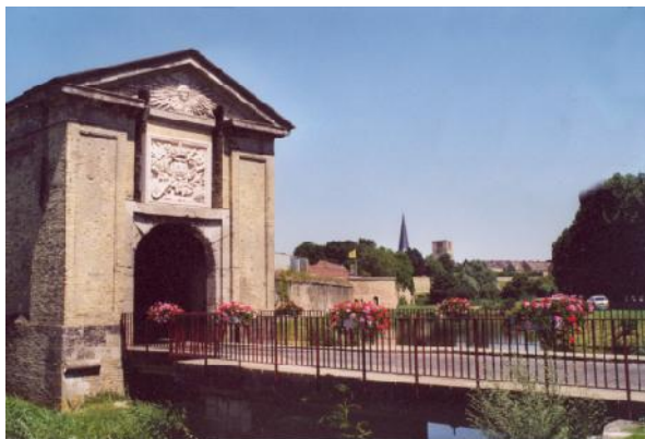
Porte de Cassel et tours de l'abbaye

Nombreuses possibilités d'hébergement ou de restauration à Bergues même ou dans les environs immédiats (hôtels, restaurants, chambres d'hôtes estaminets, pizzerias, gîtes ruraux).