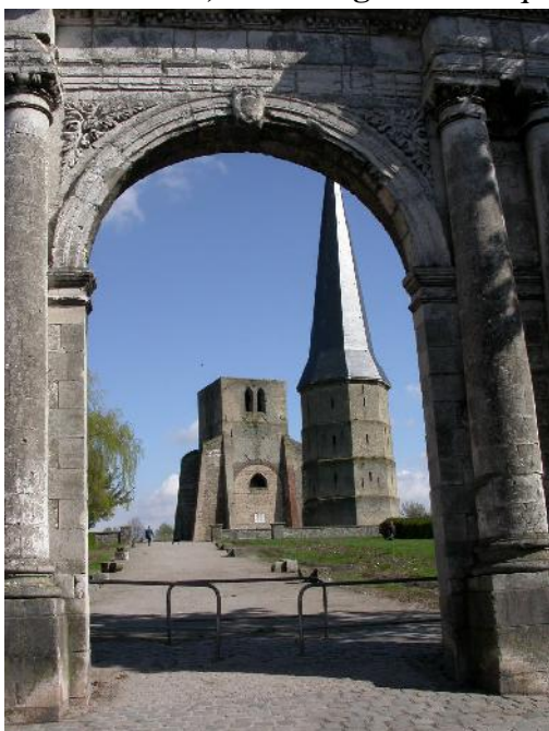
Ruines de l'abbaye St Winoc sur le Groenberg