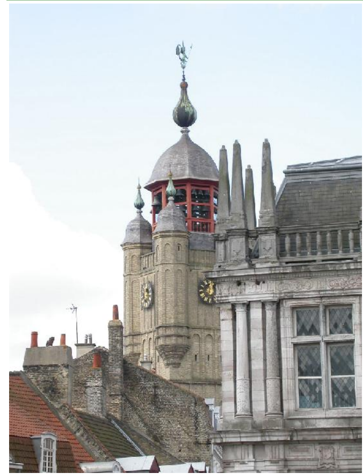
Impression Ville de Bergues - Août 2008 - Ne pas jeter sur la voie publique